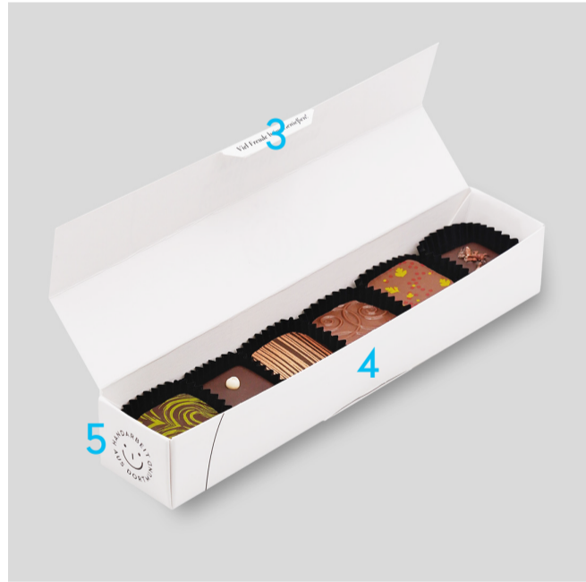
Zeichnungen sind maßstabsgetreu